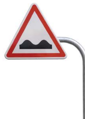
coude équerre avec retour Ø 60 : dimensions disponibles